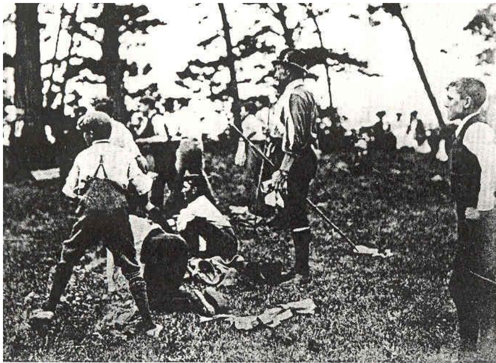
Остров Броунси 1-9 августа 1907 года Первый в мире скаутский лагерь

В 1876 году Б-П был направлен в Индию как молодой офицер-специалист по военной разведке, картографии и маскировке. Его значительные успехи позволили ему вскоре начать вести полевые занятия с молодым пополнением.