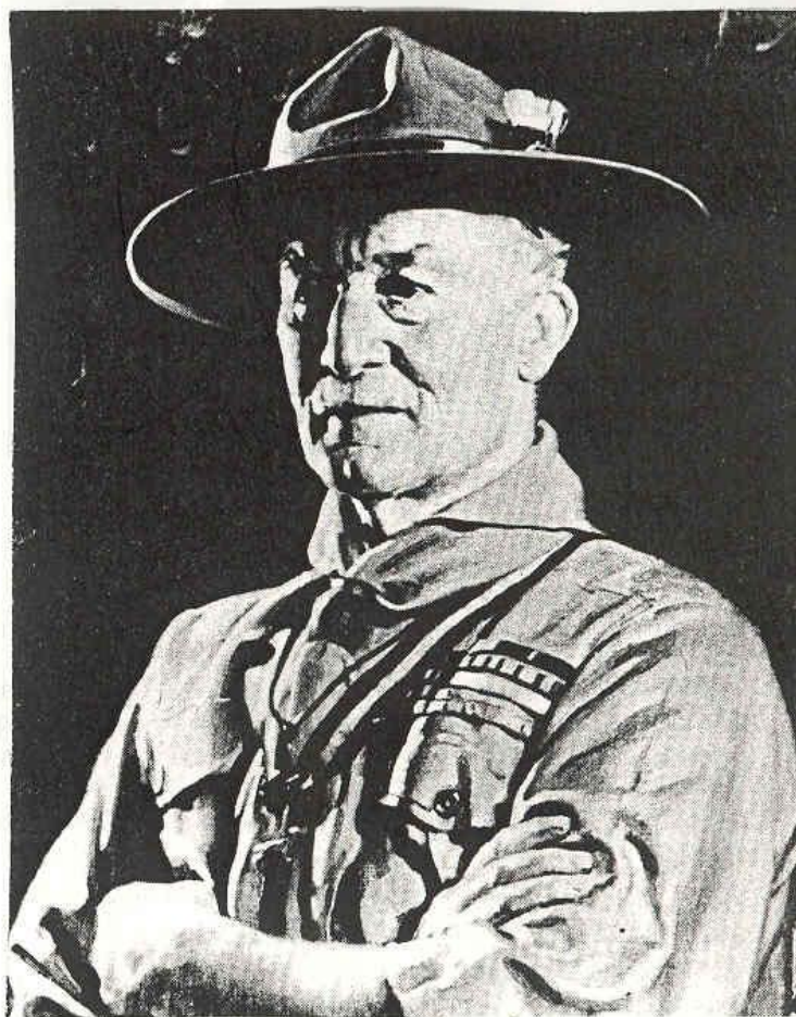
Лорд Баден-Пауэлл Гилвелла. Портрет написан Дэвидом Жагером в 1929 году

Б-П не получал отличных отметок в школе, о чем свидетельствуют табели об окончании учебного года. Например, в одном из его табелей записано: „Математика-почти ничего не делал во время занятий“, в другом: „Французский-мог бы иметь лу-