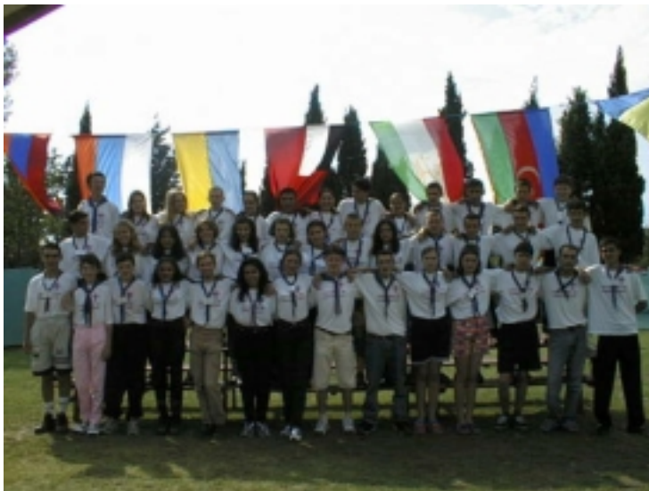
Участники "Excelscout - 99"